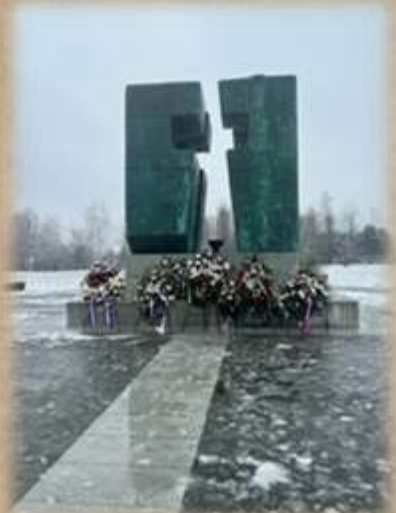
Memorijalno groblje Vukovar