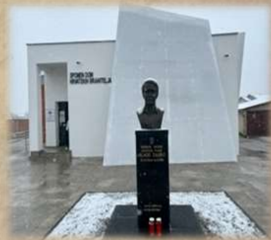
Spomen dom hrvatskih branitelja