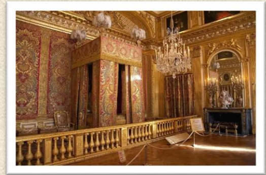
Ulaz u kraljevu spavaću sobu