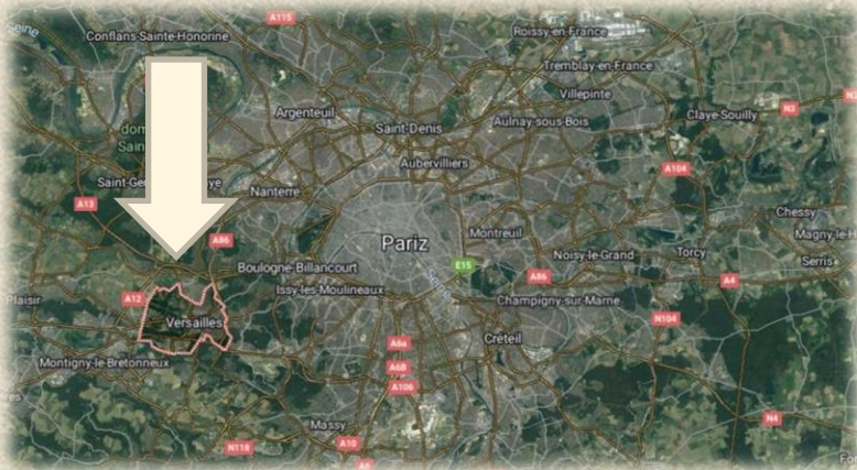
Prikaz Versailles-a iz satelita na karti

Dvorac Versailles nalazi se u pokraniji Île-de-France na sjeveru Francuske. Smješten je 16 km jugoistočno od Parisa.