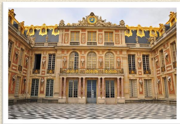
Vanjsko uređenje i simetričnost