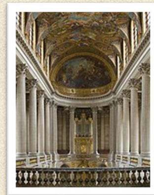
Kapela u dvorcu