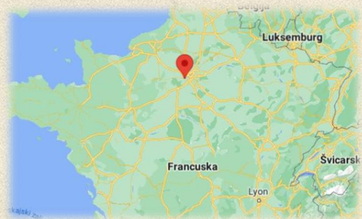
Prikaz Versailles-a na karti Francuske