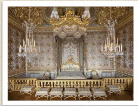
Odaje u palači Versailles

U cijelom je dvorcu prisutno zadivljujuće, bogato uređenje specifično za razdoblje baroka. Interijer se sastojao od mnogo pozlate, bogatih, jarkih boja, mnogo reljefa i raznih ornamenata, cvjetnih tkanina, kristalnih i staklenih dodataka, raskošnog namještaja i velikih lustera namijenjenim za svijeće. Dvorac ima čak 2300 prostorija.