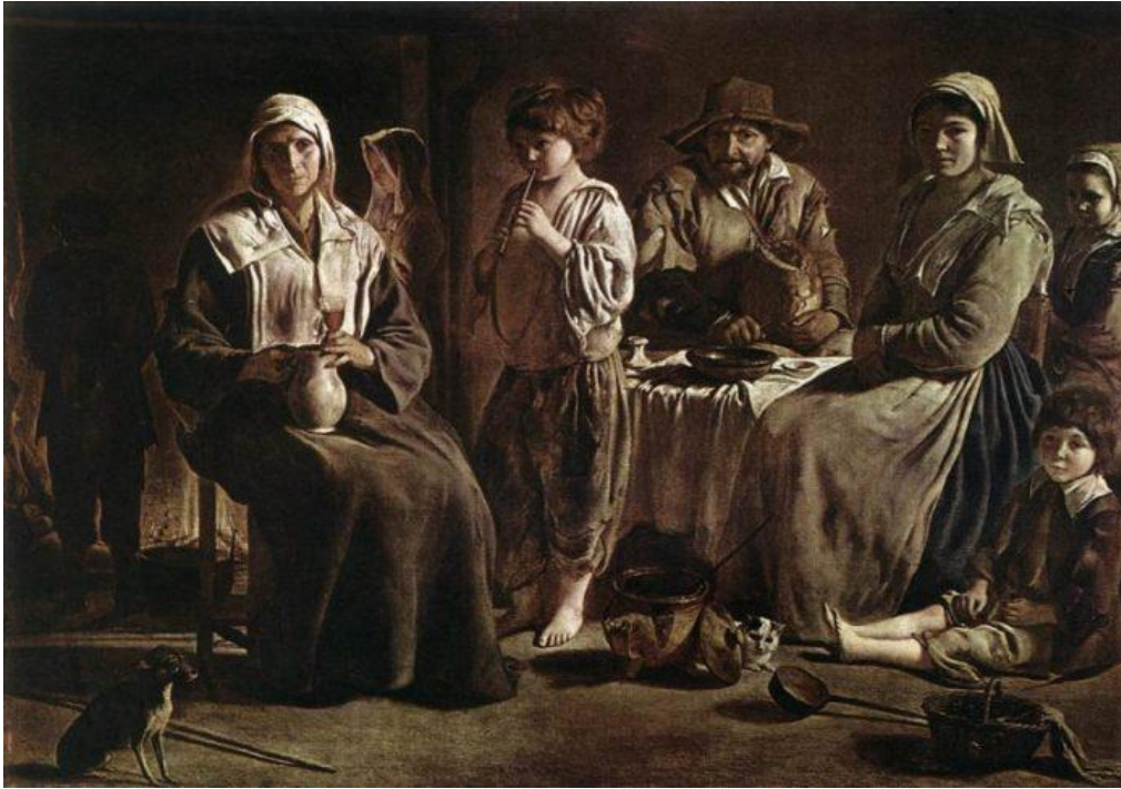
obitelj u srednjem vijeku

Prostor seoske obitelji najčešće je obuhvaćao jednu prostoriju, gdje je u prosjeku živjelo 8 do 10 osoba, a time privatnosti gotovo nije bilo. Osim toga, u takvim je prostorijama često postojao i dio gdje su se držale životinje.