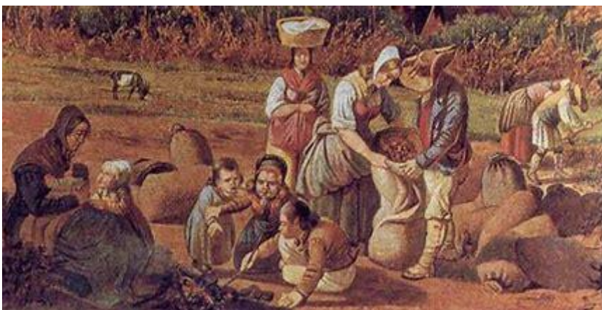
rad od ranog djetinjstva

U takvim okolnostima unutar obitelji nedostajala je dublja emotivna povezanost između roditelja i djece. Tek u XIII. stoljeću stvara se put prema jačoj povezanosti djece sa obitelji i to prvo u građanskim obiteljima. U višim staležima se nakon navršene šeste godine djeteta poziva učitelj koji ih poučava u kući. Od XI. stoljeća biskupske škole u gradovima u kojima su se u početku poučavali samo budući svećenici otvorene su svima i brinule se o poučavanju mladih. Tamo su dječaci učili čitati, pisati, pjevati, računati. Djevojčice bi ostajale kod kuće i pripremale se za brak, što je bio događaj koji će brzo uslijediti jer su se djevojčice udavale već maloljetne, tj. znatno prije navršenih 18 godina života.