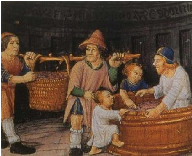
Slika 3. Djeca pomažu obitelji u poslu

mogućnost ići u školu ili bi samo dječaci išli u školu i to kod svećenika, dok bi djevojčice učile o domaćinstvu od ženskih članova obitelji starijih od njih. Dječaci iz plemićkih obitelji također su se mogli školovati i mogli su postati doktori, odvjetnici ili biskupi.