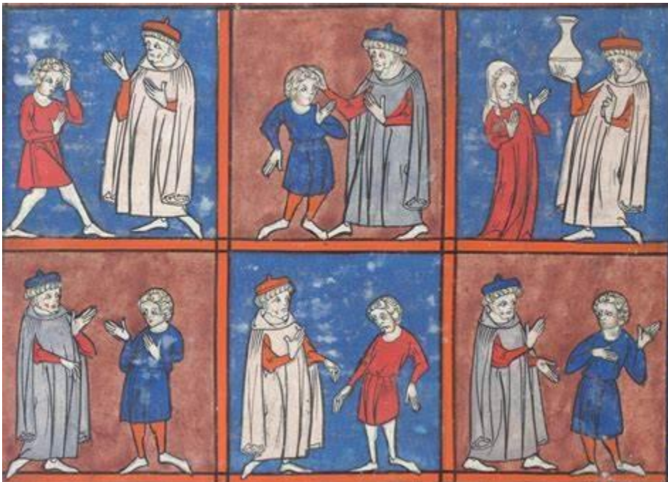
Slika 2. Doktori u srednjem vijeku

Danas djeca imaju lijekove koji im pomažu da brže ozdrave. Djeca u srednjem vijeku znala su umirati od svakakvih bolesti, naprimjer visokih temperatura, crijevnih viroza, vodenih kozica, a danas za to imamo lijek i ne smatramo to teškom bolesti. Zahvaljujući razvijenoj medicini, neke se bolesti više ne pojavljuju.