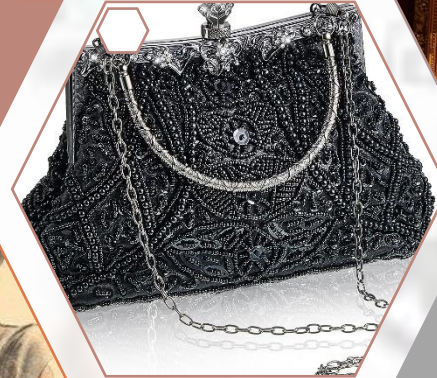
Nakit (biseri, zlato, platina, ukrašeno dragim kamenjem)