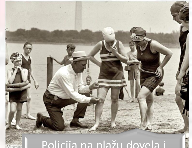
Policija na plažu dovela i krojače koji su radili hitne modifikacije