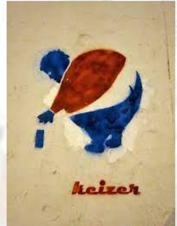
Grafit protiv konzumerizma