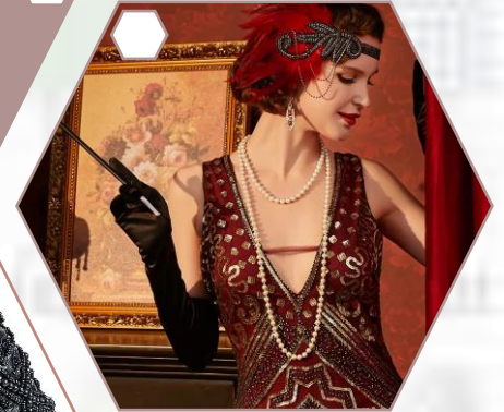
Šminka (naglašene oči, crveni ruž)