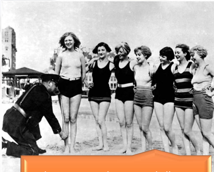
Policija patrolira po plažama i mjeri kostime