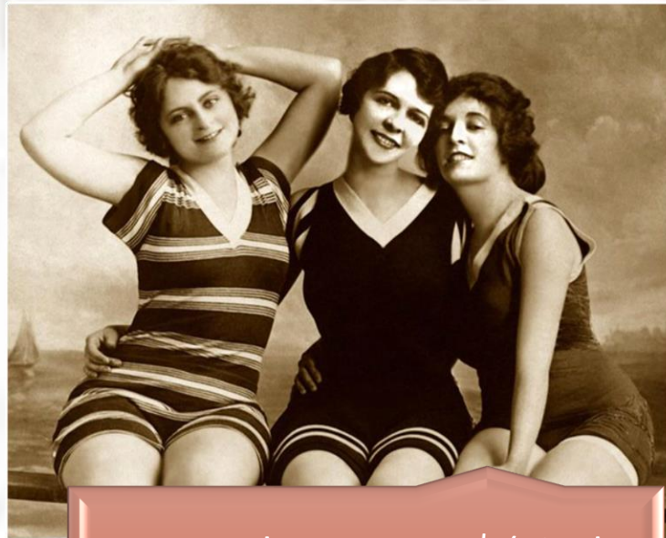
Paprene kazne – 10 $ (visoko u ono vrijeme)