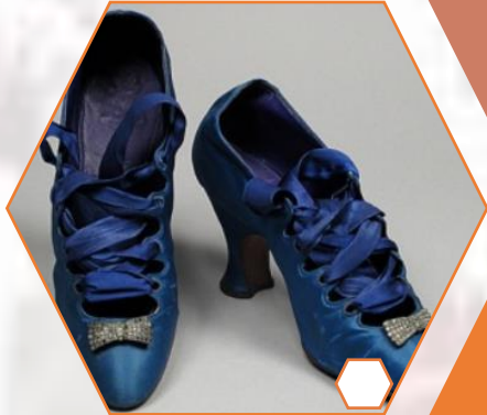
Cipele (T-strap s ukrasima)