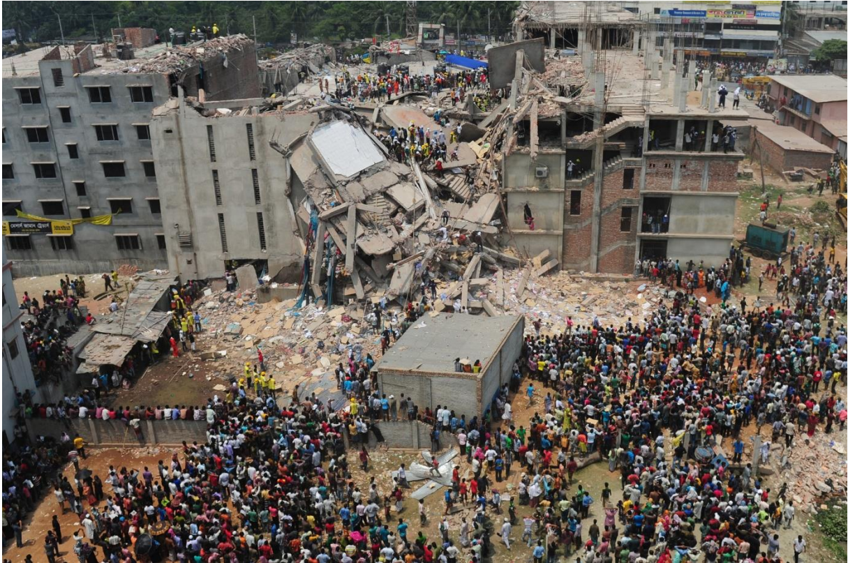
Slika 4. urušavanje poslovne zgrade „Rana Plaza“, Bangladeš 2013.