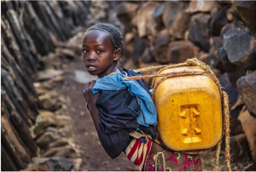
Slika 2. dijete radnik u Tanzaniji, današnje vrijeme