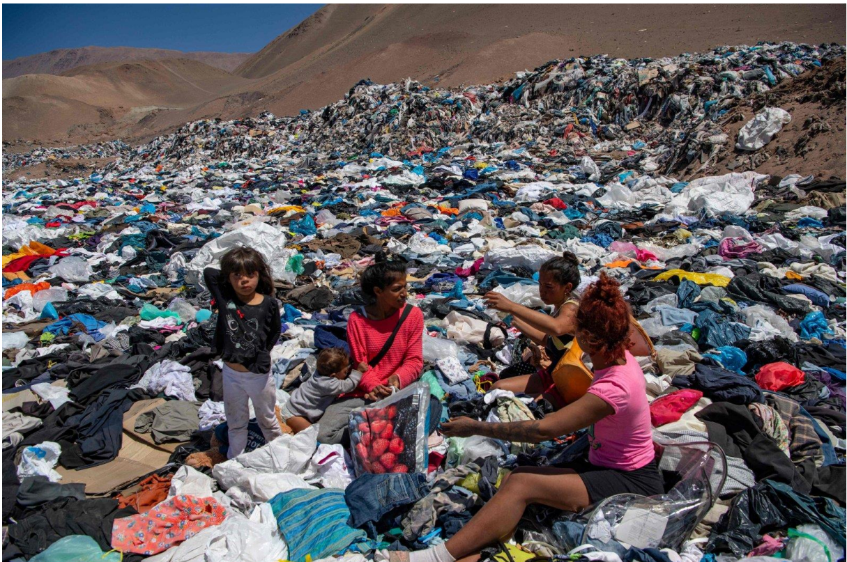
Slika 5. odlagalište neprodane robe (brza moda)