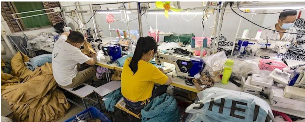
Slika 3. radnici u SHEIN tvornici