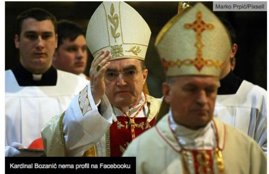
Kardinal Bozanić nema profil na Facebooku

Četvrtak, 04. 4. 2013. u 19:00 Piše: Željka Krmpotić